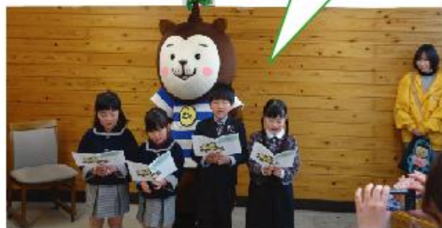
むうちゃんとエコ宣言

わたしたちは、水や電気を大切に使い、 ものを大事にして、きれいな地球を守ります。