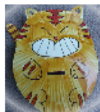
好きな絵でココロちょ金箱↑