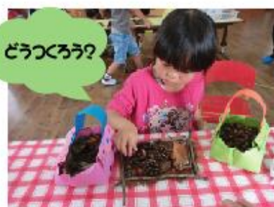
トングリ壁掛け作り