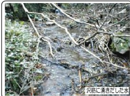
沢筋に湧きだした水