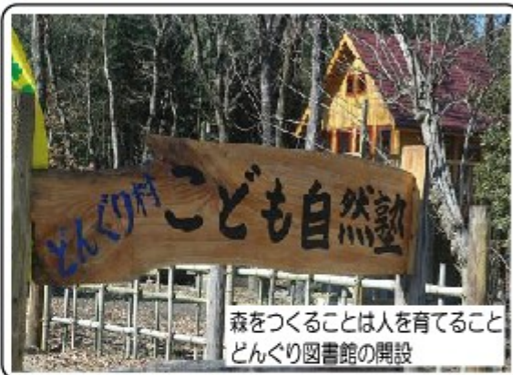
森をつくることは人を育てること どんぐり図書館の開設