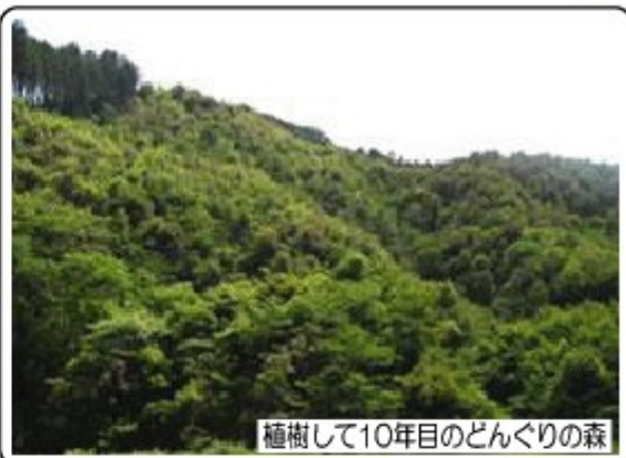
植樹して10年目のどんぐりの森

森づくりの基本は「大きなかしの木の小さなどんぐりから」 1粒のどんぐりは森を再生し、すべての生命の源になります。 私たちは、今「行動すること、続けること」を大事にしています。