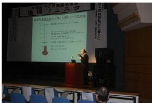
◎特別講演「地球温暖化と科学コミュニケーションの課題」 講師 山本良一氏(元東京大学生産技術研究所教授)