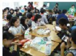
先日開催された住吉小学校での出前講座

宮崎県環境情報センター 〒880-0031 宮崎市船塚3丁目210番地1(宮崎県立図書館内)