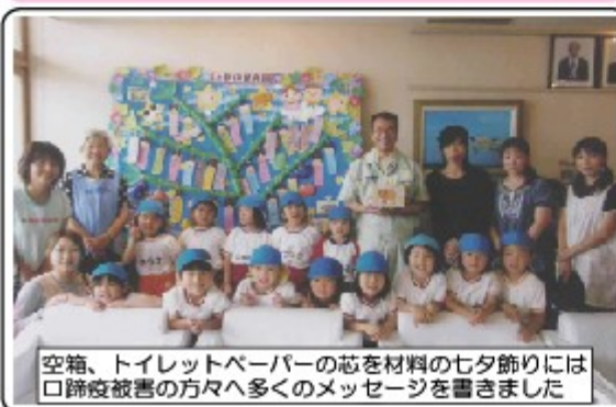
空箱、トイレペーパーの芯を材料の七夕飾りには口蹄疫被害の方々に多くのメッセージを書きました