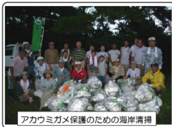
アカウミガメ保護のための海岸清掃