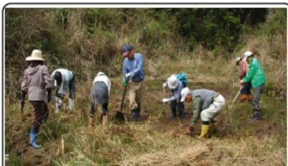
田んぼに残る希少植物の保護活動

「楽しい活動」が合言葉。県内の自然保護活動 をしています。----- 活動の後の食事会が目当ての人も増加中! ?