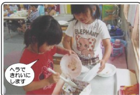
ヘラできれいにします