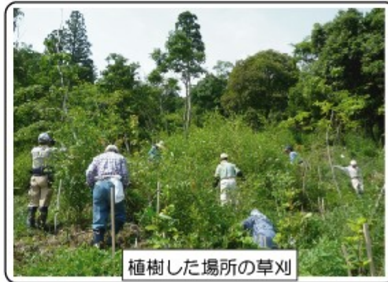
植樹した場所の草刈