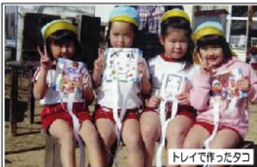
トレイで作ったタコ

（コメント）不用品を利用したおもちゃ作りや小物作りをしています。お買い物ごっこのおもちゃ、ペットボトルのマラカス、牛乳パックの鉛筆立て等も不用品で作ります。