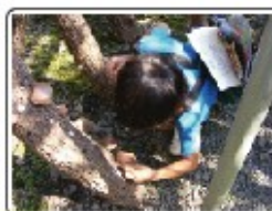
昨年のシイタケ取り体験 （林業技術センター）

昨年と同じく「宮崎やまんかん祭り」に合わせて開催しますので、「杉コレ2009 in 日南」も見学出来ます♪