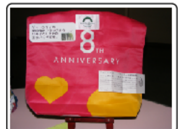
ゲートシティの使用済みフラッグで作られたバッグ

今回は、前回の「古代のエコバッグ」展示に対し「近代のエコバッグ」と題して、今、出回っているいろいろな種類のエコバッグを展示します。どうぞお気軽にセンターへお立ち寄りください♪