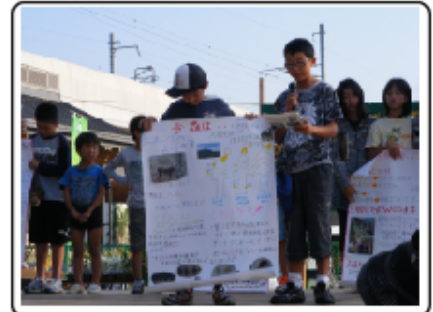
6. 壁新聞発表 (日向市駅前)