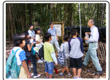
3. 菌床・原木シイタケの説明 (林業技術センター)