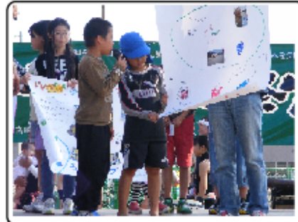
5. 壁新聞発表 (日向市駅前)