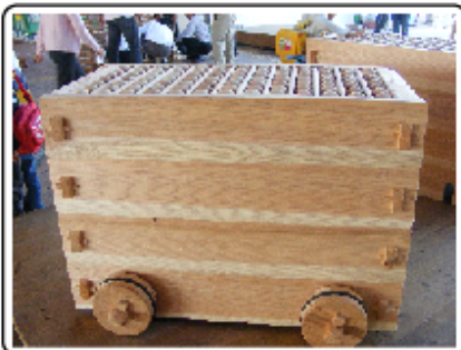
1. 杉コレクション2008を見学 (日向市駅前)

今年度の宮崎県子どもエコクラブ交流会は10月18日にJR日向市駅で開催された、「宮崎やまんかん祭り」会場と宮崎県林業技術センターで実施されました。宮崎県産の木材をふんだんに使用したJR日向市駅会場では杉コレクション2008を見学し、宮崎県林業技術センターでは「葉脈しおり作り」や「シイタケ取り」の体験が出来て、とても楽しい交流会となりました♪