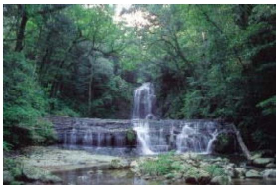
わにつか県立自然公園

自然公園における利用施設の整備については環境省直轄事業、自然環境整備交付金事業、県費単独事業、市町村に対する県費補助事業等の制度があり、国・県・市町村により執行されています。