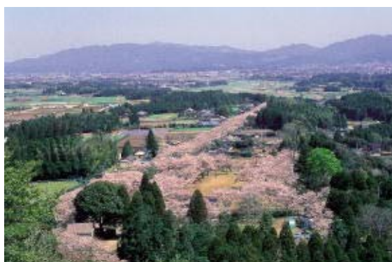
母智丘関之尾県立自然公園