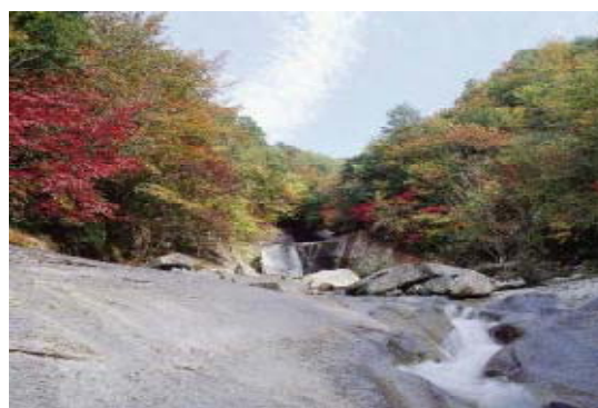
祖母傾県立自然公園