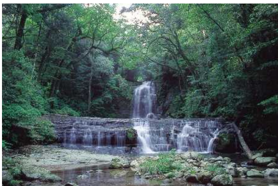
わにつか県立自然公園

自然公園における利用施設の整備については環境省直轄事業、自然環境整備交付金事業、県費単独事業、市町村に対する県費補助事業等の制度があり、国・県・市町村により執行されています。