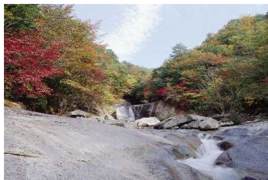
祖母傾県立自然公園