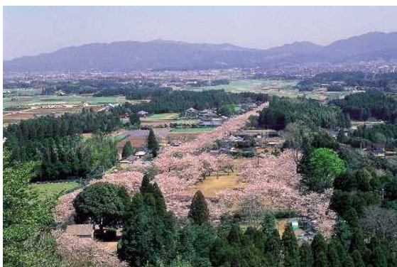
母智丘関之尾県立自然公園