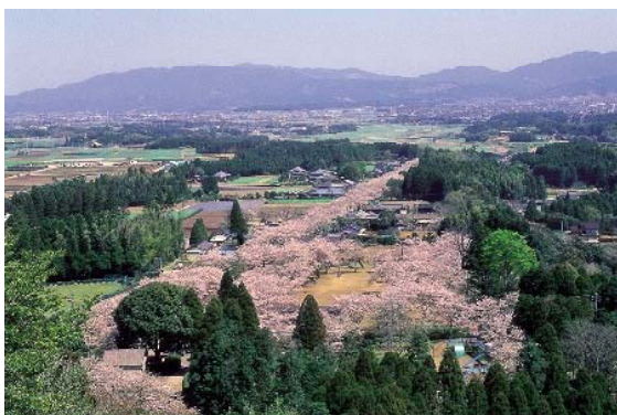
母智丘関之尾県立自然公園