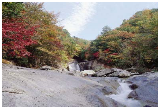
祖母傾県立自然公園