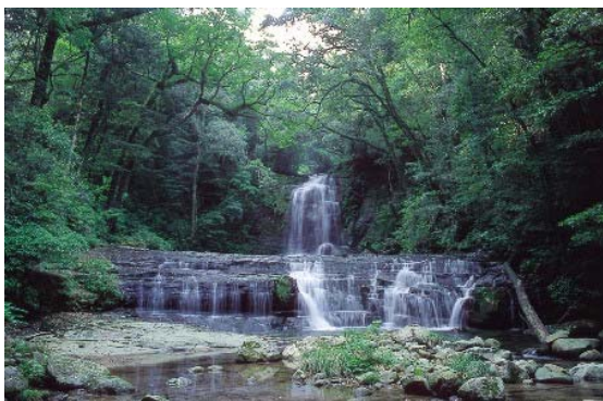
わにかが県立自然公園

自然公園における利用施設の整備については環境省直轄事業、自然環境整備交付金事業、県費単独事業、市町村に対する県費補助事業等の制度があり、国・県・市町村により執行されています。