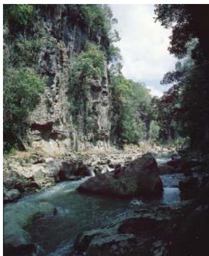
三之宮峡緑地環境保全地域

現在、森谷観音緑地環境保全地域、大斗滝緑地環境保全地域、三之宮峡緑地環境保全地域、長谷観音緑地環境保全地域の4か所が指定されており、各地域にそれぞれ1名の自然保護指導員を配置して、地域の保全に必要な監視、立入者に対する指導等を行っています。