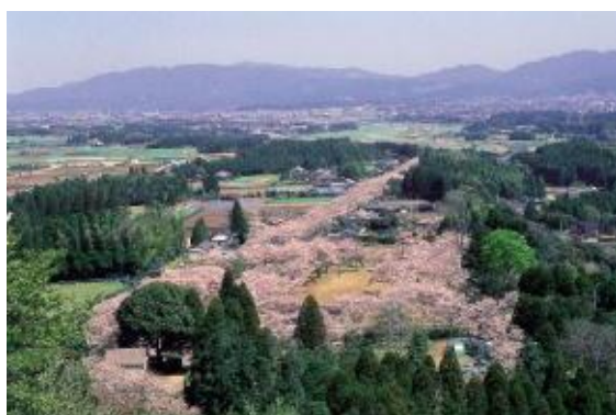
母智丘関之尾県立自然公園