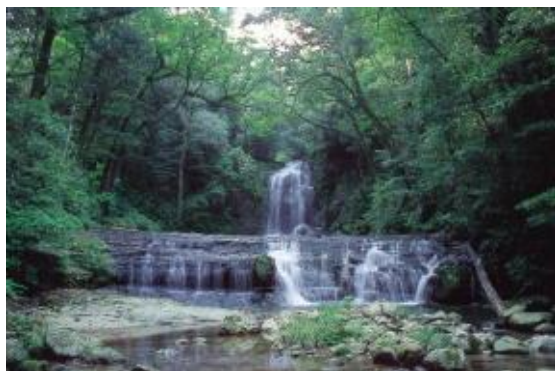
わにか県立自然公園

自然公園における利用施設の整備については環境省直轄事業、自然環境整備交付金事業、県費単独事業、市町村に対する県費補助事業等の制度があり、国・県・市町村により執行されています。