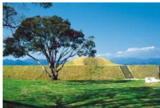
西都原杉安峡県立自然公園