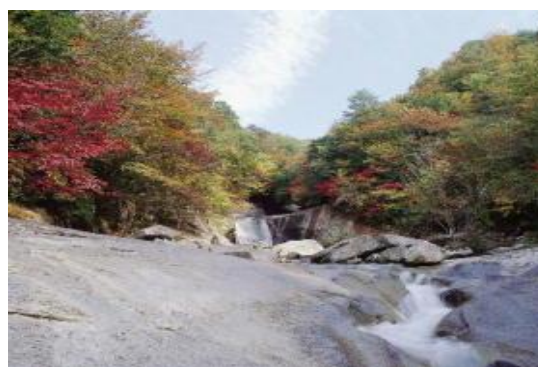
祖母傾県立自然公園