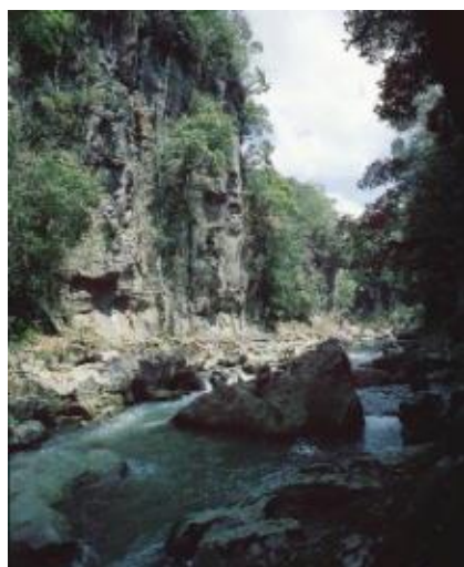
三之宮峡緑地環境保全地域

現在、 もりたに 森谷観音緑地環境保全地域、 おせりのたき 大斗滝緑地環境保全地域、三之宮峡緑地環境保全地域、 はせ 長谷観音緑地環境保全地域の4か所が指定されており、関係市町村と連携して、地域の保全に必要な監視、立入者に対する指導等を行っています。