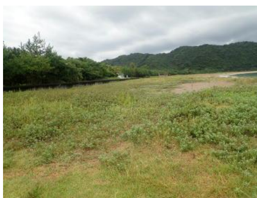
重要生息地（熊野江川河口海浜域）