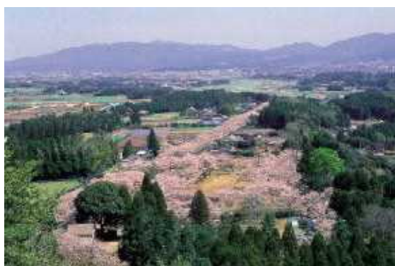
母智丘関之尾県立自然公園