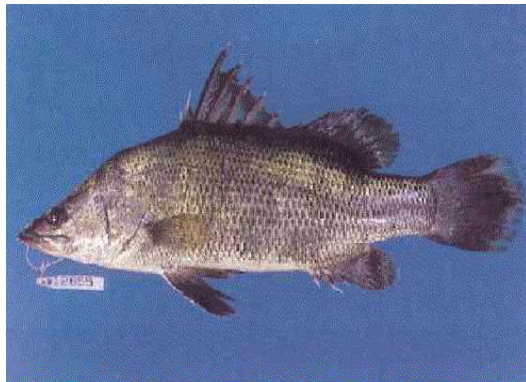
指定希少野生動植物（アカメ）

重要生息地は、令和4年3月の熊野江川河口海浜域（延岡市）の指定により、現在、14か所となっており、新たな重要生息地の指定に向け、調査・検討を行っています。