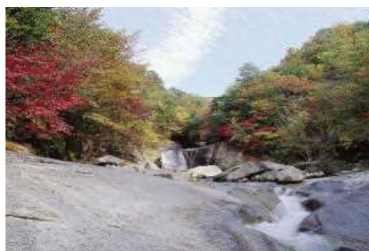
祖母傾県立自然公園