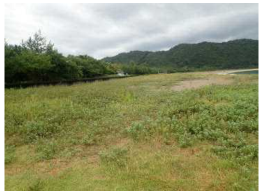
重要生息地（熊野江川河口海浜域）