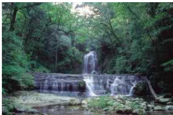
わにか県立自然公園

自然公園における利用施設の整備については環境省直轄事業、自然環境整備交付金事業、県費単独事業、市町村に対する県費補助事業等の制度があり、国・県・市町村により執行されています。