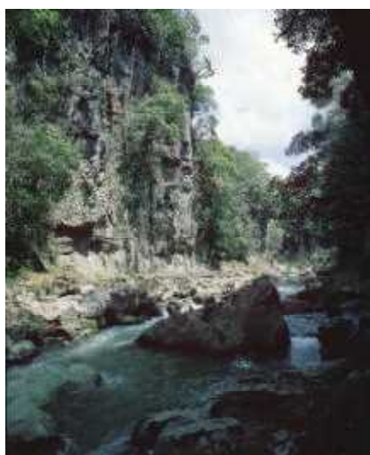
三之宮峡緑地環境保全地域

現在、 もりたに 森谷観音緑地環境保全地域、 おせりのたき 大斗滝緑地環境保全地域、 はせ 三之宮峡緑地環境保全地域、長谷観音緑地環境保全地域の4か所が指定されており、関係市町村と連携して、地域の保全に必要な監視、立入者に対する指導等を行っています。