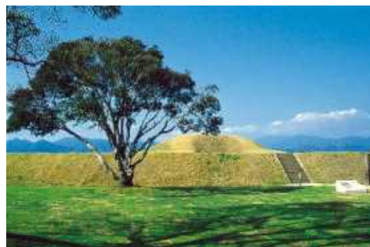
西都原杉安峽県立自然公園