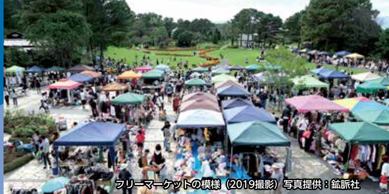
フリーマーケットの様相 (2019撮影)