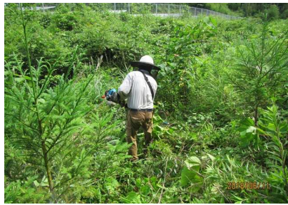
下刈支援 324ha 一ツ瀬川及び小丸川 上流域森林保全機構