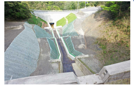
治山ダム 4基 流路工及び山腹工