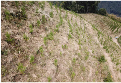
再造林 92ha 森林整備事業 (公共)