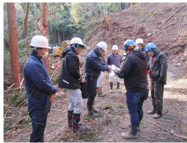
伐採パトロール 7箇所