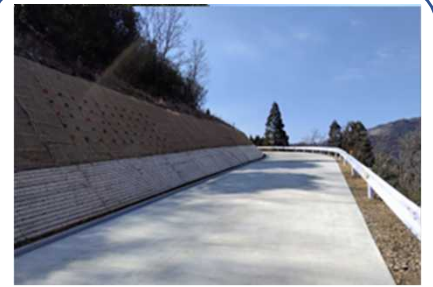
法面緑化工 コンクリート路面工 林道開設事業 (公共)