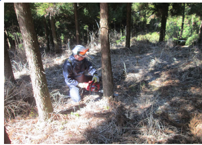
除間伐 41ha 森林整備事業 (公共)