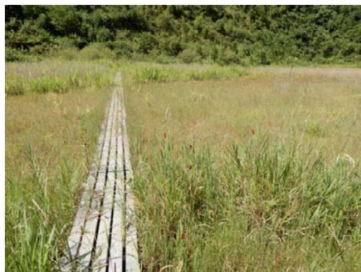
重要生息地（関之尾神田湿地）