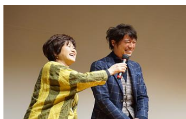
1-(2) 食べきり宣言フォーラム