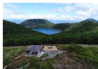
4-(1) 霧島錦江湾国立公園 えびの高原池巡り自然探勝路 展望所整備