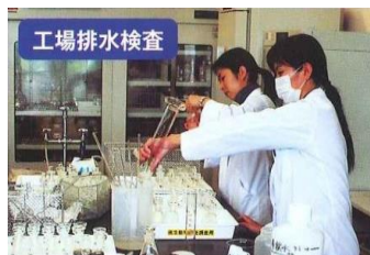
2-(1) 特定事業場排水検査