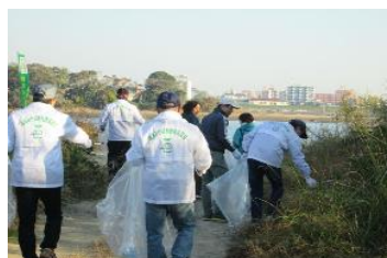
2-(2) 県民総ぐるみで行う環境美化活動「クリーンアップ宮崎」