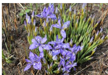
1-(2) エヒメアヤメの保全(小林市)