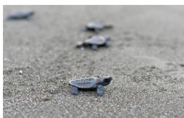
2-(2) 県指定天然記念物 「アカウミガメ及びその産卵地」