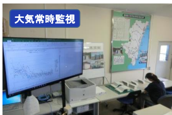
1-(1) 大気汚染状況常時監視