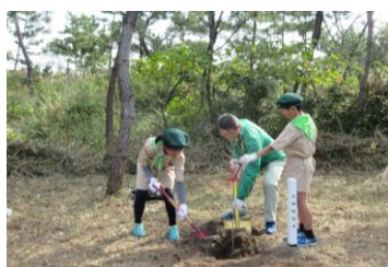
2-(1) 「水と緑の森林づくり」 県民ボランティアの集い(宮崎市)