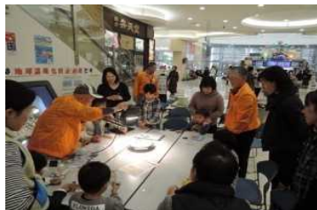
1-(1) 地球温暖化防止月間普及啓発イベント