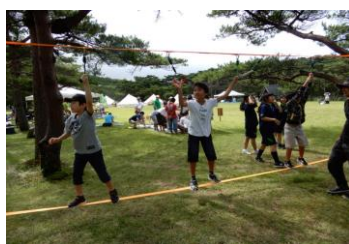
4-(1) 山の日イベント 霧島山モンテフェス(えびの市)