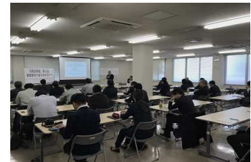
1-(2)(3) 事業者向け省エネセミナー