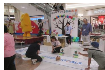
2-(2) 環境保全に関する普及啓発イベント「みやぎエコフェスティバル」