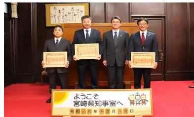
1-(2) 温室効果ガス排出抑制事業者表彰