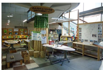
1-(4) 環境情報センター