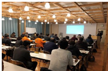
1-(4) 農家民宿開業や運営等の研修会