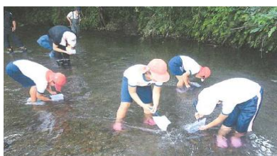
2-(3) 「五感を使った水辺環境指標」を用いた水辺環境調査