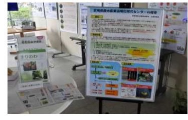
4-(4) 農水産業への温暖化の影響と対応策の 取組に関する研究成果パネル展示