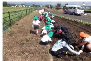
2-(1) 国県道における植栽管理