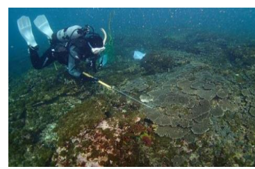
3-(2) オニヒトデの駆除