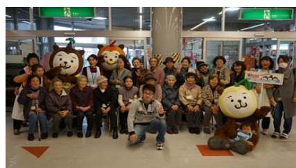
1-(2) 食べきり宣言キャラバン