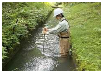
2-(2) 農業用水を利用した 小水力発電の可能性調査