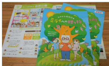
1-(1) 環境教育用パンフレット「みやぎ環境読本」