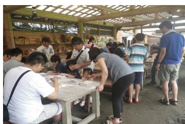
4-(1) ひなもり台県民ふれあいの森 森林レクリエーション