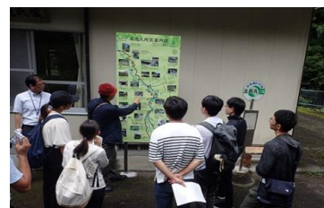
1-(1) 大学生が参加した「土呂久を学ぶフィールドワーク」