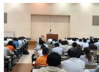
1-(3) 産業廃棄物排出事業者講習会