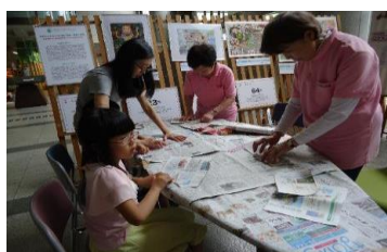
1-(1) 環境情報センターにおける環境講座