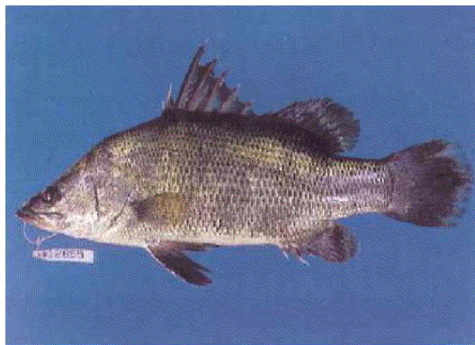
指定希少野生動植物（アカメ）

重要生息地は、平成31年3月の友内川（延岡市）の指定により、現在、11か所となっており、新たな重要生息地の指定に向け、調査・検討を行っています。