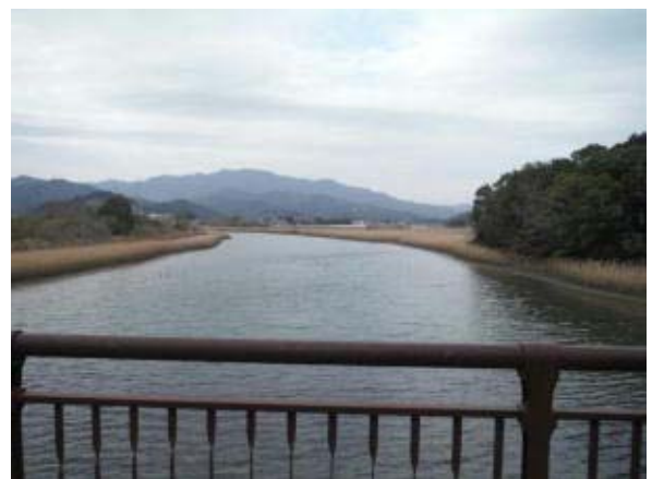
重要生息地（友内川）