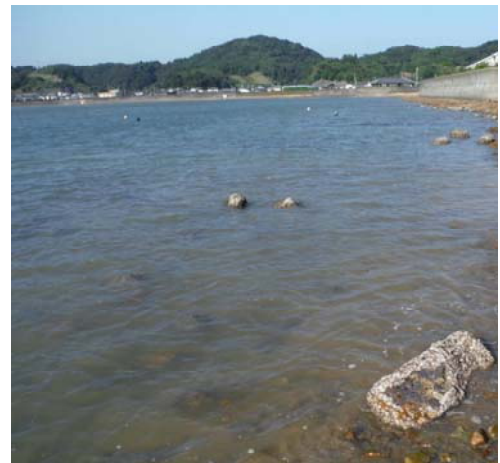
重要生息地（庵川東入江）