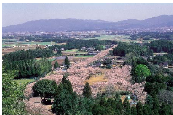
母智丘関之尾県立自然公園